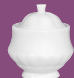
Cukiernica Sugar bowl 0,30 l