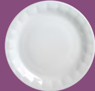
Talerz płytki Flat plate 17; 19; 24 cm