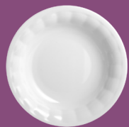
Talerz głęboki Deep plate 22,5 cm