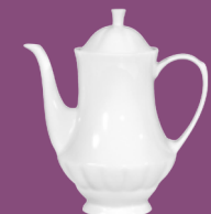
Imbryk Coffee pot 1,20 l