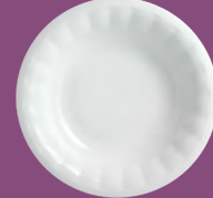
Salaterka okrągła Round salad bowl 23; 26 cm