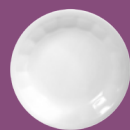
Spodek Saucer 14; 15,5 cm