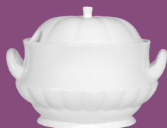
Waza Soup tureen 2,50 l